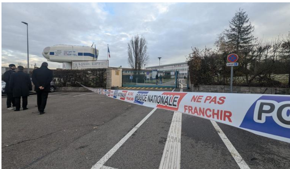
Vers 9 heures ce jeudi matin sur les lieux, l'ambiance était encore lourde.

Sur place vers 9 heures, nous avons pu constater une ambiance forcément particulière, avec notamment une quinzaine de policiers présents pour sécuriser les lieux. Si une grosse dizaine d'élèves était entourée par les forces de l'ordre, et que nous n'avons pas été autorisés à leur parler, à cause de l'enquête qui débutait tout juste, d'autres ont pu livrer leur témoignage. « Une ligne de gazoil a été mise en feu au sol, puis, à